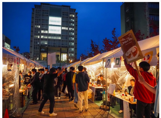
第76回九大祭の様子